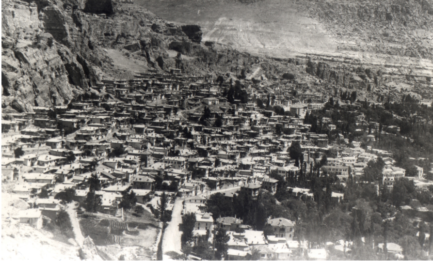
Eski Ermenek Fotograflarından